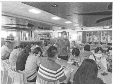
109/11/23 第 3 次課發會會議過程