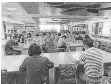
109/11/23 第 3 次課發會會議過程