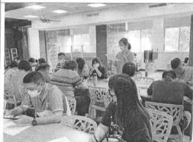
109/11/23 第 3 次課發會會議過程