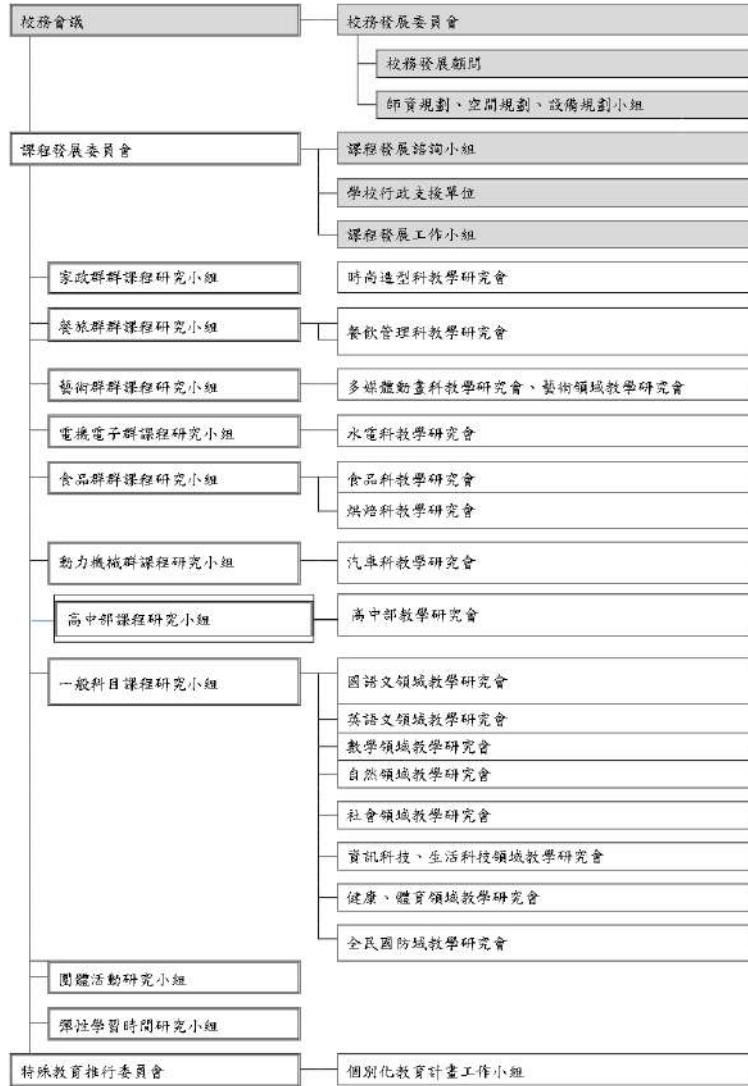
附件一：課程發展組織架構圖