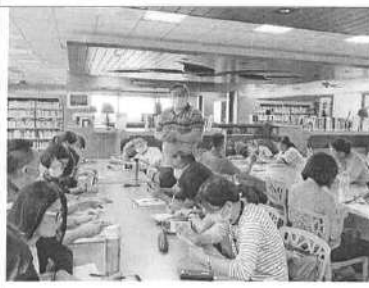
109/11/23 第 3 次課發會會議過程