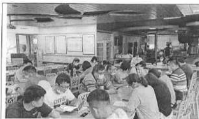
109/11/23 第 3 次課發會會議過程