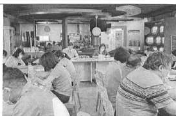
109/11/23 第 3 次課發會會議過程